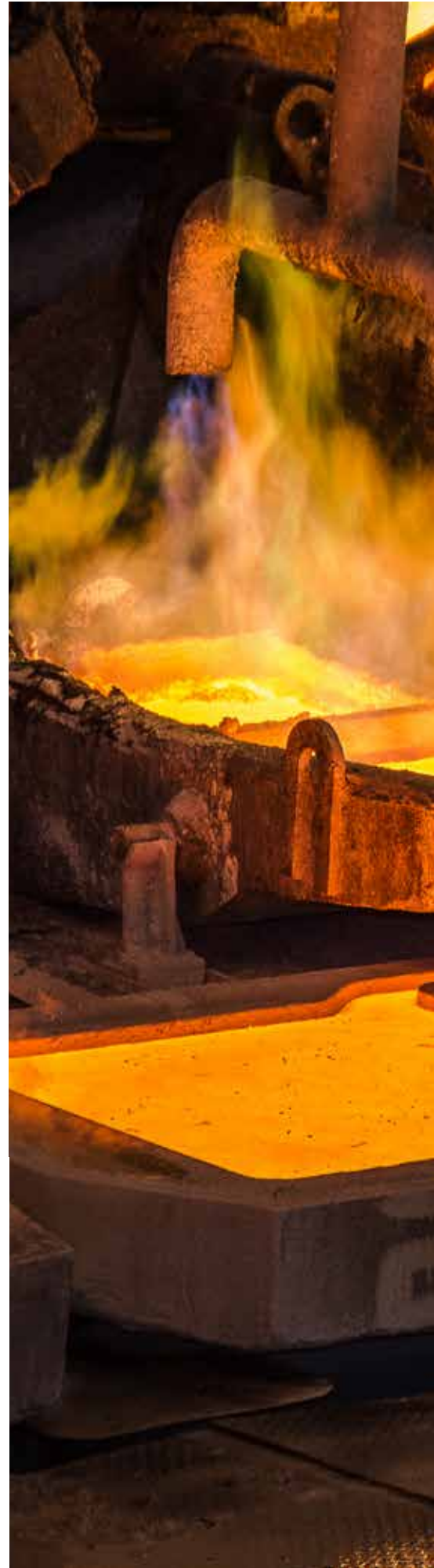
Trabajador en rueda de anodos, Fundición, Sonora, México. |