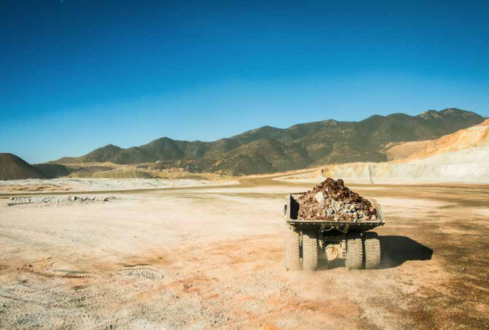
Vista en mina La Caridad, Sonora, México. |

La Compañía continuará evaluando cómo los riesgos relacionados con el clima podrían afectar sus intereses financieros y definirá respuestas adecuadas de mitigación y adaptación según sea necesario. La Compañía también continuará evaluando cómo la demanda de metas de reducción de emisiones de GEI globales y nacionales podría incrementar la carga regulatoria y la demanda de productos con bajo contenido de carbono o libres de emisiones de carbono por parte de clientes, inversionistas y partes interesadas en general. Recientemente, los inversionistas han estado solicitando a la Compañía que divulgue sus metas de reducción de emisiones de GEI alineados al Acuerdo de París para limitar el aumento de la temperatura global por debajo de 2 grados centígrados. Actualmente, la Compañía está en proceso de definición de nuevas metas de reducción de emisiones y de un mapa de ruta de descarbonización, los cuales se harán públicos en el siguiente informe.