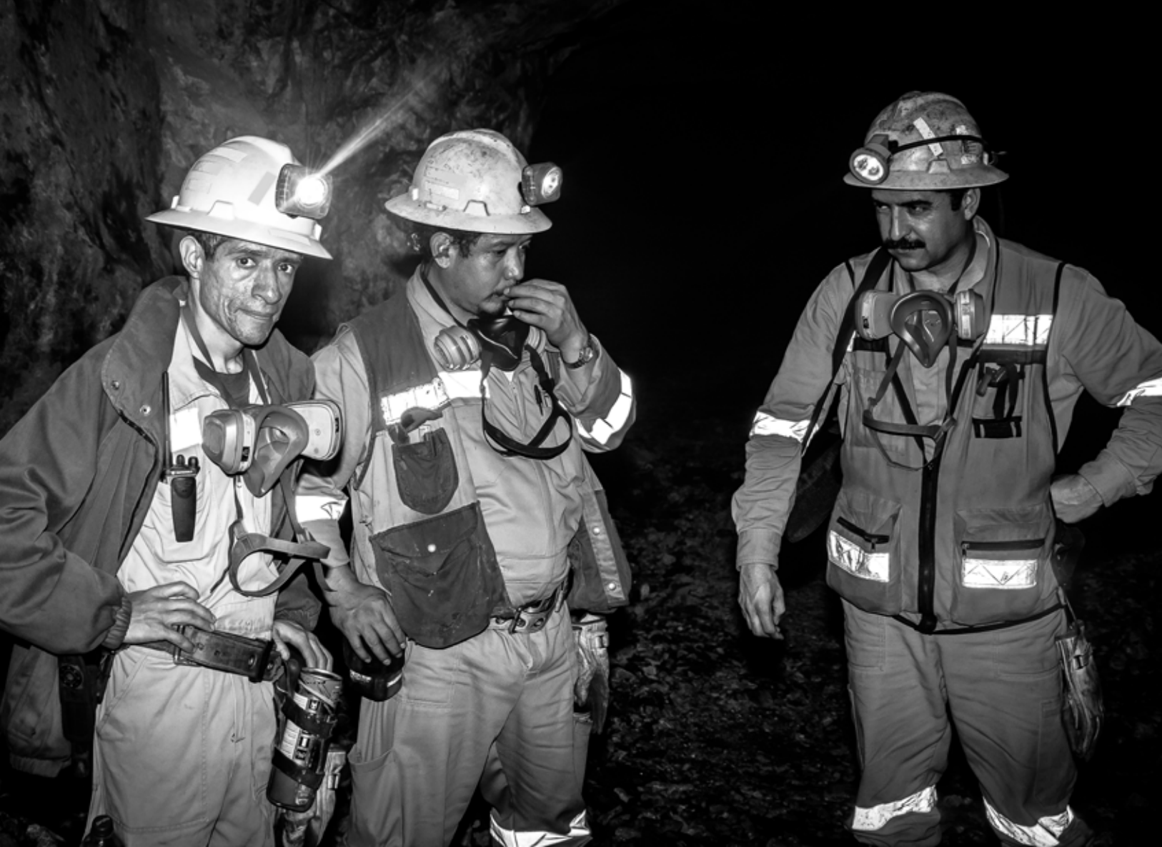
Trabajadores en mina Santa Bárbara, Chihuahua, México. |