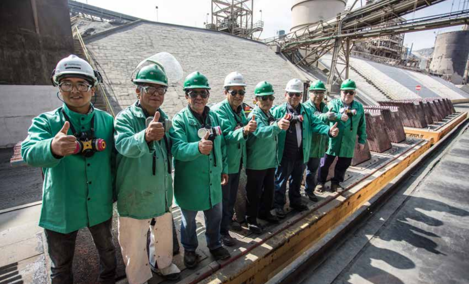
Trabajadores en patio de Fundición, Ilo, Moquegua, Perú.

Sobre la base del Informe N° 313-98-EM/DGM/DPDM, de fecha 21 de mayo de 1998, se autoriza el funcionamiento a la capacidad ampliada de 300,000 t/año.