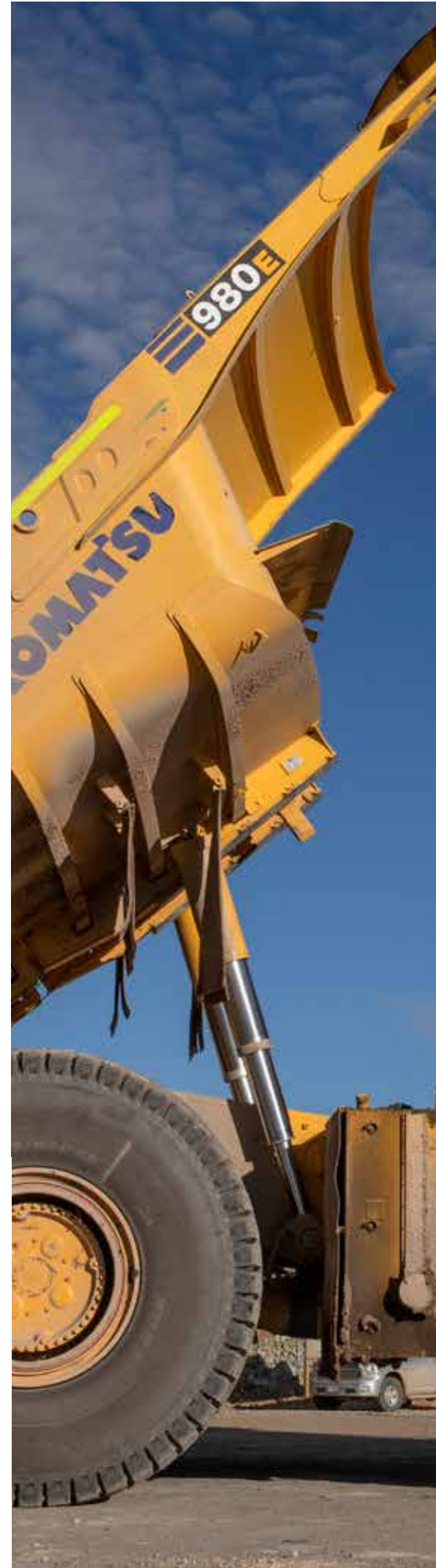
Camión de mineral de 400 toneladas en Buenavista del Cobre, Sonora, México. |