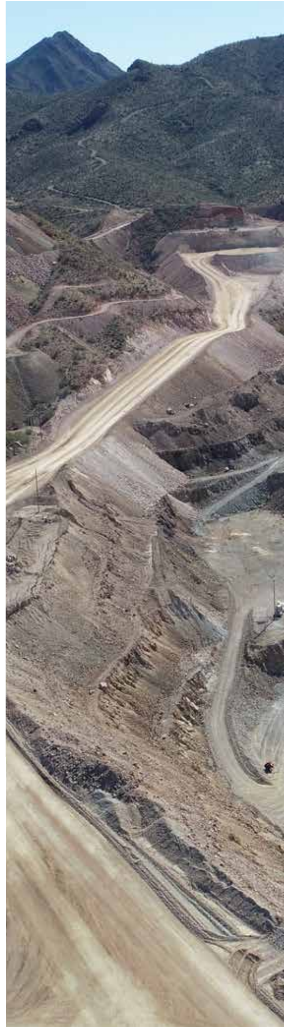
Vista panorámica de mina La Caridad, Sonora, México. |