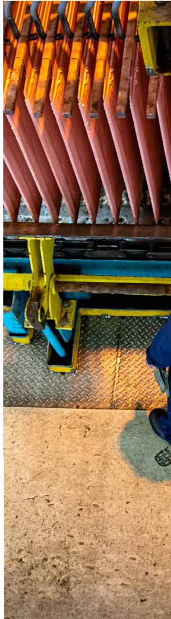
Cosecha de cátodos de refinera, Ilo, Moquegua, Perú. |